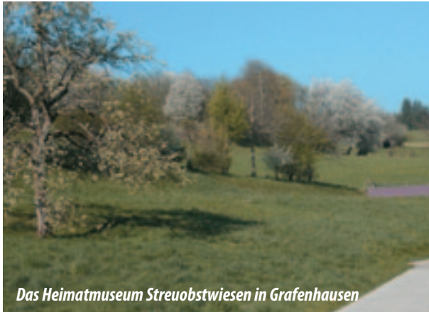
Das Heimatmuseum Streuobstwiesen in Grafenhausen

Diese prägten auch die Umgebung von Grafenhausen und waren wichtiger Bestandteil der Selbstversorgung der Bevölkerung mit Obst. Im Frühjahr waren die prächtig blühenden Obstbäume schon von weitem als blühender Ring um Grafenhausen zu sehen. Dieses Kultur- und Naturerbe sollte nach unserer Überzeugung erhalten werden, so wie Baudenkmäler und Kirchen.