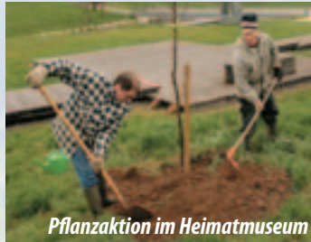
Pflanzaktion im Heimatmuseum

🍏 Pflanzen Sie alte Hochstamm-Obstbäume , die sich für die klimatisch raueren Lagen um Grafenhausen eignen. Eine umfangreichere Liste der am besten geeigneten Sorten erhalten Sie beim NABU Grafenhausen.