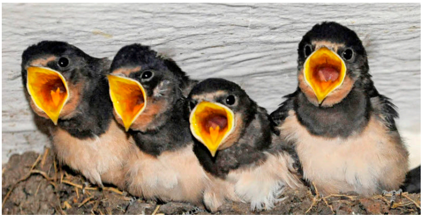
Das Futter und die Nistplätze werden knapp. Das bekommen auch die Mehlschwalben zu spüren.

Seit zwei bis drei Jahren ist der Rückgang der Vögel so signifi-